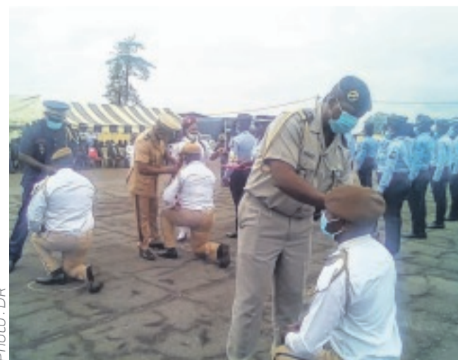
Moment de distinction pour la gendarmes et matons.

Aux promus de la Sécurité pénitentiaire : « Je voudrais, comme vos confrères de la gendarmerie nationale, vous féliciter pour le mérite de vos différents grades. Qu'il me soit permis de vous rappeler que le tableau d'avancement ayant milité en votre faveur pour l'accession au grade supérieur, est le résultat d'une Commission qui a statué sur tous les cas, en fonction des critères bien définis », a précisé le lieutenant-colonel.